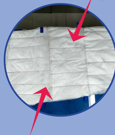
Антистатический нетканый материал