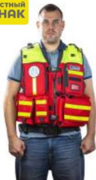
Жилет разгрузочный ЖР-01, цвет красный Арт.: 1234