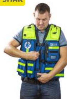
Жилет разгрузочный ЖР-01, цвет синий Арт.: 1236